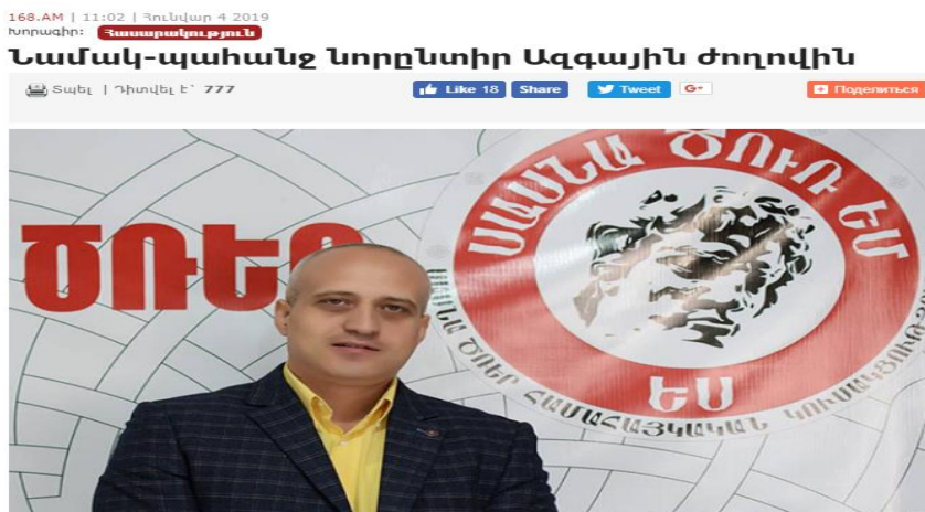
Նամակ-պահանջ նորընտիր Ազգային ժողովին

Առաջարկում եմ, որ նորընտիր Ազգային ժողովն իր լիազորություններն ստանձնելուն պես անմիջապես վերանայի մեր երկիր մուտքի վիզա ստանալու անհրաժեշտությունը: