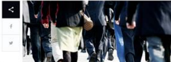
The America of “Black” Indians

Artashes Papazyan 21:49, 19 դեկտեմբեր 2018 578 մեկնում